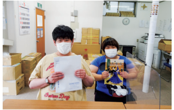
いつも作業を担当して下さるお二人

社会福祉法人HOP 豊平MAX 〒062-0008 札幌市豊平区美園8条1丁目3-23