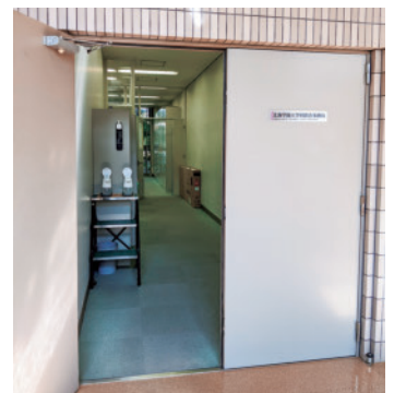
北海学園大学同窓会事務局入口