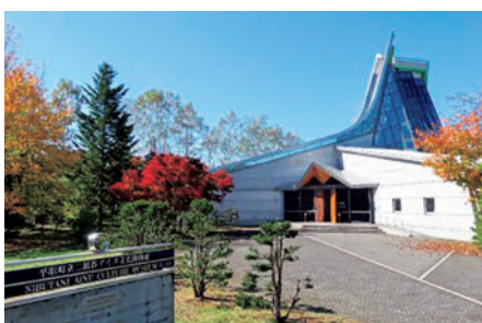
平取町立二風谷アイヌ文化博物館

今後この基本的なルールを拠り所として、農林業をはじめとする一次産業の振興、アイヌ文化の継承、国立公園化が待たれる日高山脈襟裳国定公園を核とする観光産業の活性化、主に木質バイオマスを活用したゼロカーボン施策などにも新たな視点で取り組んでいきたいと考えています。