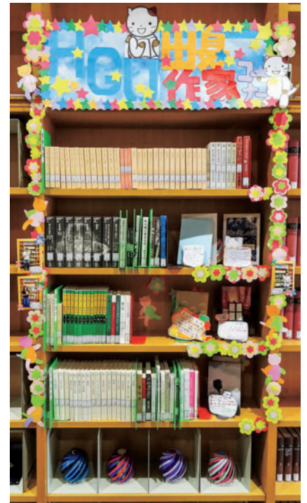
本学出身作家コーナー

図書館2階に「北海学園大学出身の作家コーナー」を常設、100冊以上の図書が並んでいます。3階には「直木賞・芥川賞作品コーナー」も展開、ノミネート作品も扱っています。くわしくは、図書館ホームページ（ https://library.hgu.jp/ ）をご覧ください。本学卒業生・修了生の方へのご利用についてもご案内しております。