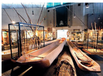
平取町立二風谷アイヌ文化博物館(展示室)