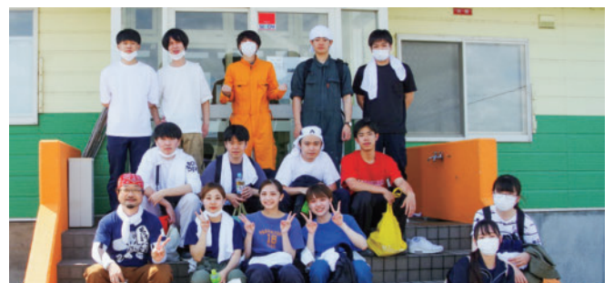
2022年度空き家リノベーション活動1巡目に参加した学生・卒業生の面々

この活動は、行政や民間が知恵を絞る多様な空き家対策の一面であり、建築を学ぶ学生にとっては知識を実体験として吸収する場、地方小都市の地域文化に触れる貴重な機会でもあります。地域と学生との両者に意味のある2度目の産声を聞き続けられるよう取り組んでいきたいと思えます。