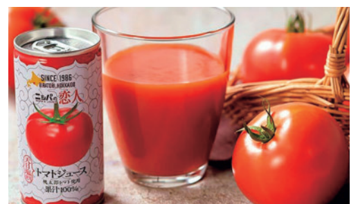
ひらとりトマト・トマトジュース「ニシバの恋人」