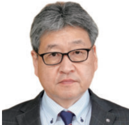
遠藤 桂一 平取町長 (経済学部1部経済学科 第27期・昭和55年卒業)

平取町は日高振興局管内の西に位置し、札幌の中心部までは車で1時間30分、新千歳空港までは50分の距離にあります。総面積743.09km 2 、人口4,645人(令和4年6月末現在)の町です。町名の平取(ひらとり)はアイヌ語「ピラ・ウトル」(崖の間)を意味しています。