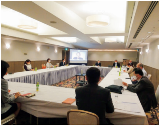
オンラインも併用した「会報部会」の様子

6月8日(水)18時より2022(令和4)年度第1回「会報部会」が開催されました。