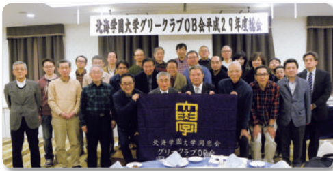
グリーンクラブOB会 (4.22)