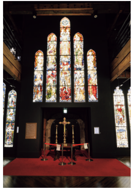
「神とイギリスの栄光」(1919年頃)

小樽芸術村ミュージアム ショップ (旧荒田商会) 1935 (昭和10)年に荒田商会の本店事務所として建築された。小樽運河沿いに建ち、背面の旧高橋倉庫とむすび、歴史的景観のまとまりを創っています。2017年夏までアール・ヌー