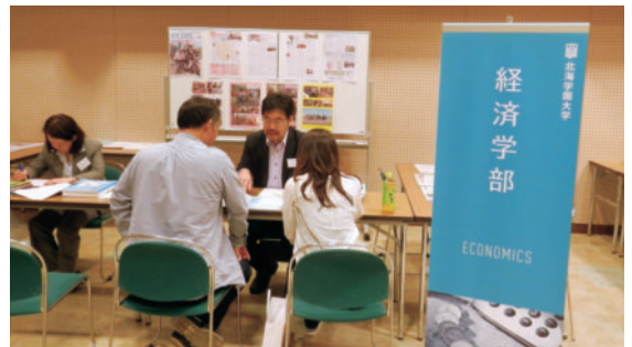
昨年の個別相談会風景