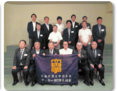
サッカー部 OB 会 (7.8)