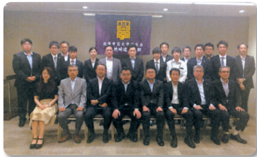
岩田地崎建設支部 (7.21)