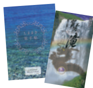
島牧村の魅力が満載のリーフレット

そういう人たちの感性・感覚というのは私たちが気づかない価値を見出してくれるものです。ですからこの大自然という資源を活用した交流の中から島牧村に定着する人が増えていってくれば良いと考えています。性急に結果を求めるのではなく、村の魅力についてじっくりと理解をしてもらうという姿勢です。風光明媚で温泉もありますので、皆さんのお越しをお待ちしております。