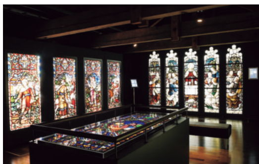
「種蒔く人」（左手前）と「最後の晩餐」（右奥）