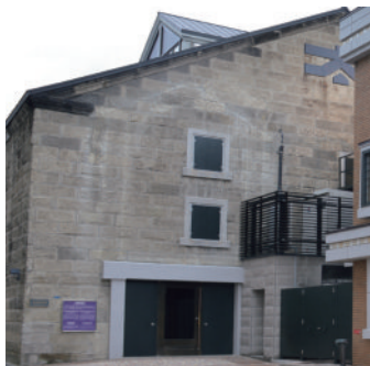
スタンドグラス美術館 (旧高橋倉庫)