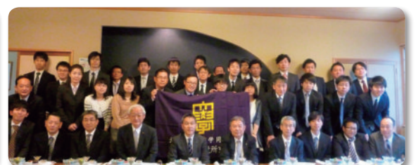
岩見沢市役所支部 (5.24)