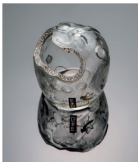
エミール・ガレ《獅子頭文置物》1876年