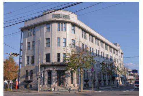
似鳥美術館 (旧北海道拓殖銀行小樽支店)