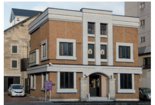
小樽芸術村ミュージアムショップ(旧荒田商会)