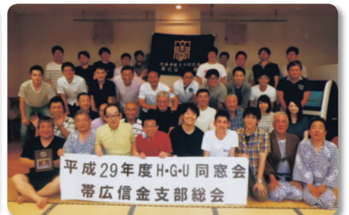
帯広信用金庫支部 (5.20)