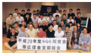
H29年 支部総会 女性会員もおります

平成29年度は5月20日に開催し、同窓会宮本副会長様にご臨席頂き会員57名中41名の参加で行いました。今年度3名の新入会員歓迎会および来春定年会員に還暦祝の記念品贈呈を併せて行いました。