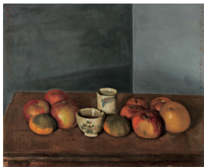
岸田劉生《静物（リーチの茶碗と果物）》1921年