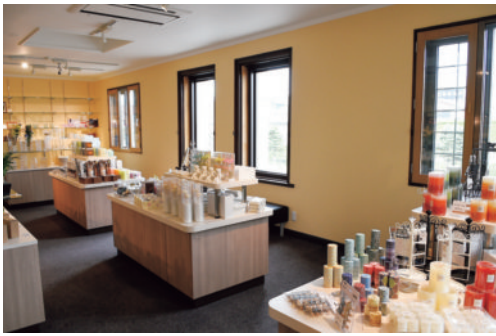
2階から見える運河の景観も人気です

小樽芸術村ミュージアム ショップ (旧荒田商会) 1935 (昭和10)年に荒田商会の本店事務所として建築された。小樽運河沿いに建ち、背面の旧高橋倉庫とむすび、歴史的景観のまとまりを創っています。2017年夏までアール・ヌー