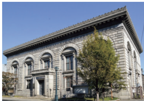
旧三井銀行小樽支店