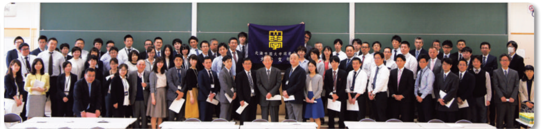
北海学園大学支部 (5.23)