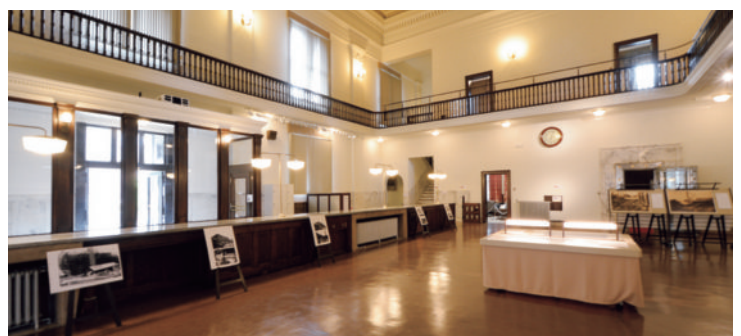
カウンター内部にはパネルが展示され当時の様子が伝わります