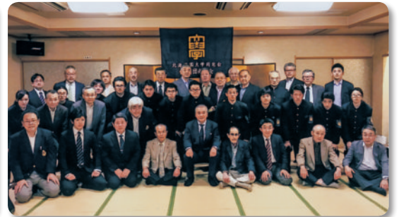
応援団 OB 尚志会 (6.24)