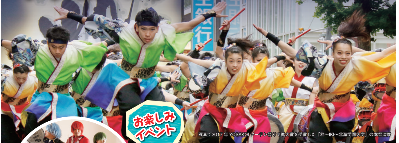
写真：2017年 YOSAKOI ソーラン祭りにて準大賞を受賞した「粋~IKI~北海学園大学」の本祭演舞